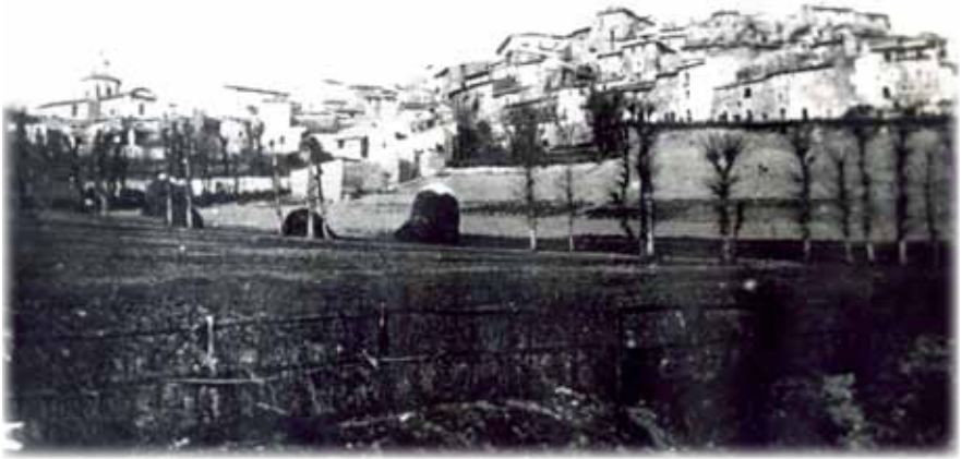
Sopra: Cerchio in una fotografia di Antonio d'Amore Fracassi (primi anni del Novecento); sotto: gruppo di donne cerchiesi in costume