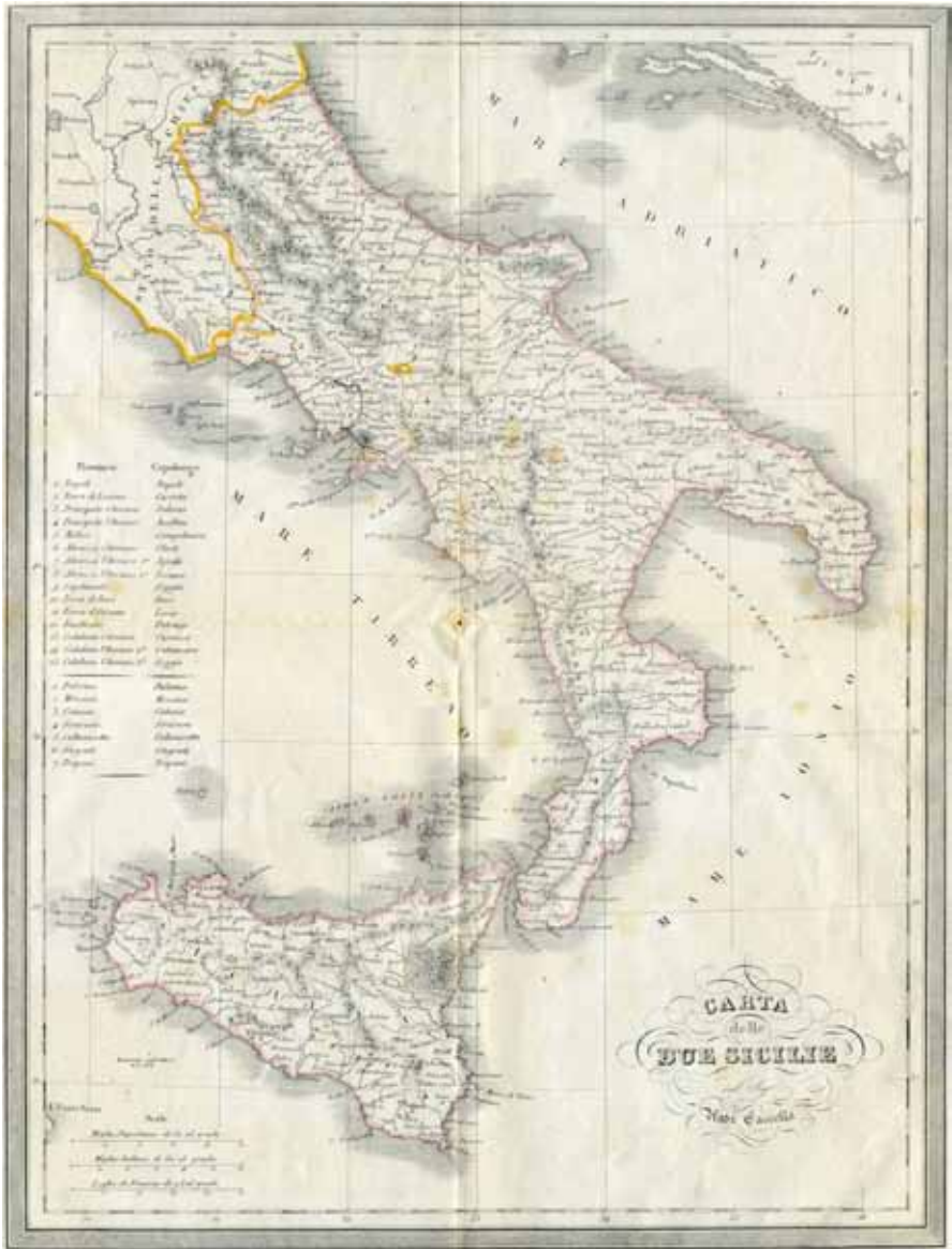
Carta ottocentesca del Regno delle Due Sicilie (A. Cassella. Calcoligrafia Fratelli Doyen, Torino)