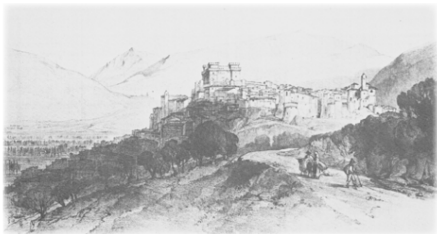
Celano e la rocca di Pescina in due vedute di Edward Lear (1843-1844)